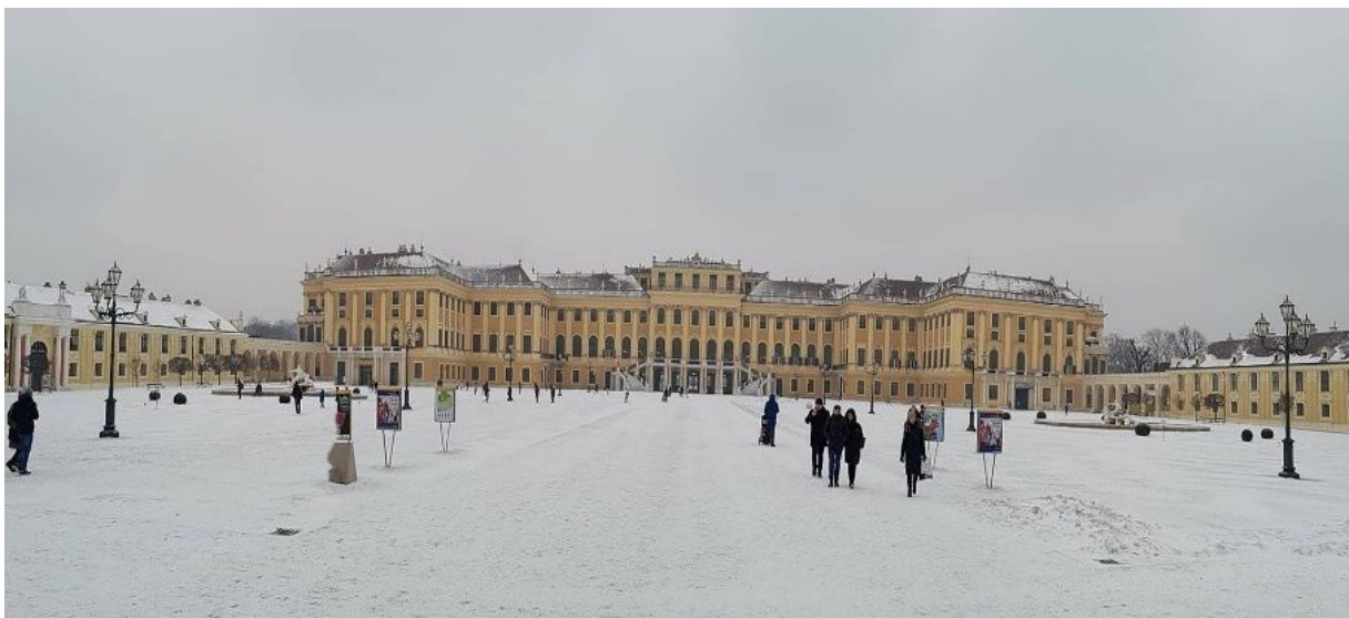
3. ábra Schönbrunni kastély télvíz

Szerencsémre idő közben belefért a helyi nevezetességek megtekintése is, csak úgy, mint stephanplatzi Dóm, a befagyott Holt-Duna ág, vagy a Schönbrunni kastély (3. ábra).