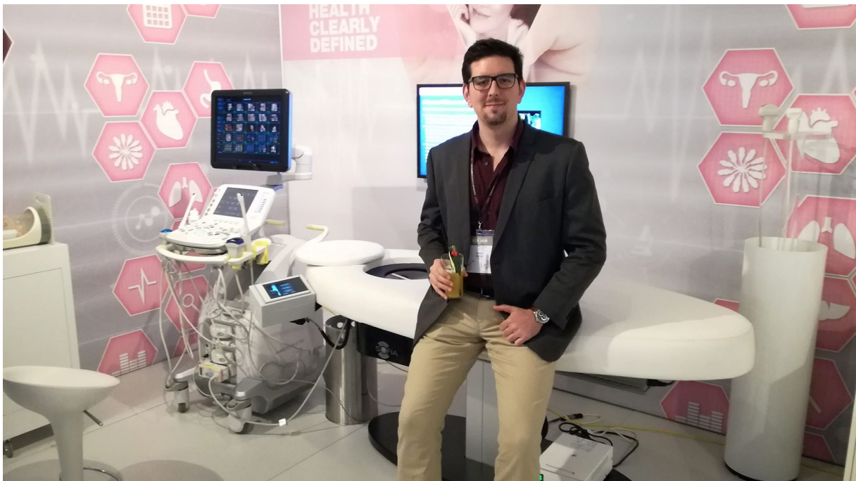
2. ábra ECR 2018 kiállítás ultrahang berendezés