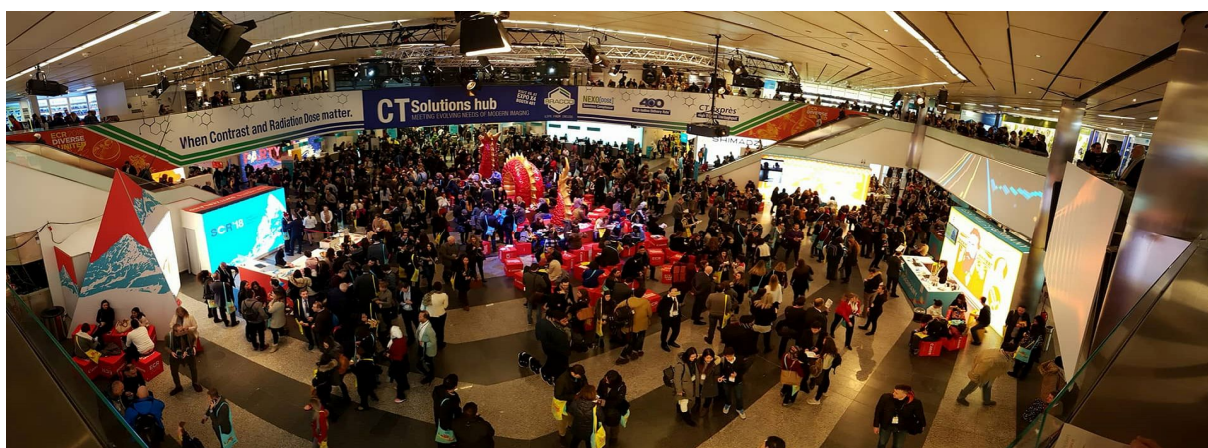
1. ábra ECR 2018

Második illetve harmadik és negyedik napon megtörtént a kongresszus látogatása. Egy kiállító és egy előadó épületben zajlott az esemény. Előbbiben voltak a különböző szekciók (1. ábra), utóbbiban pedig a diagnosztikai berendezések/eszközökkel forgalmazó brandek képviselői. (2. ábra).